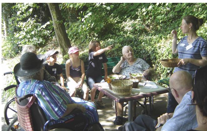
Rallye à l'EMS de Béthanie partagé par des enfants, des jeunes, des habitants du quartier et des résidents Juin 2006