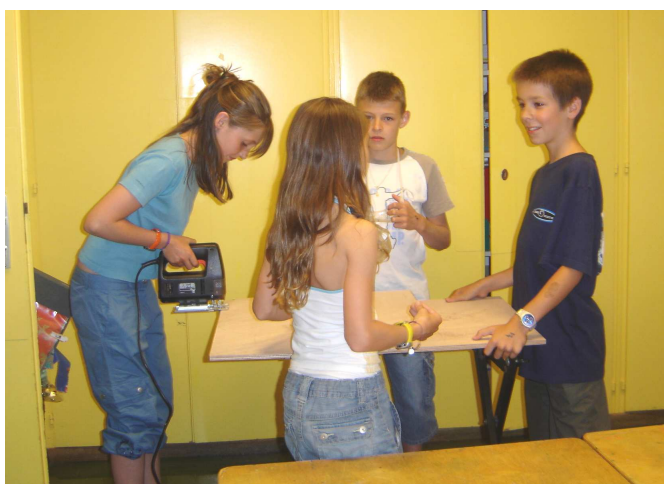
Des jeunes participent à la construction des arrêts de pédibus pour la nouvelle ligne de Pierrefleur. Juin 2006

Et s'il ne fallait retenir qu'une chose de tout ceci, et bien ce serait le terme « unis ». Oui, unis, par choix ou par nécessité, mais unis. Ceci, est quelque chose que tout le monde nous envie !