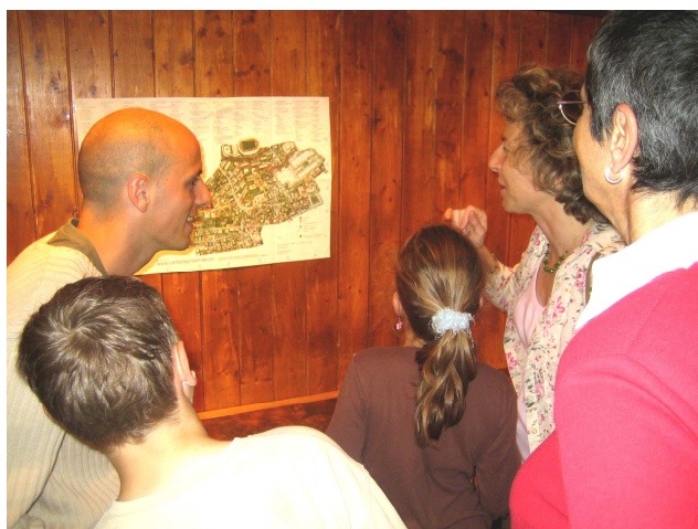
Présentation de la carte de proximité mai 2006