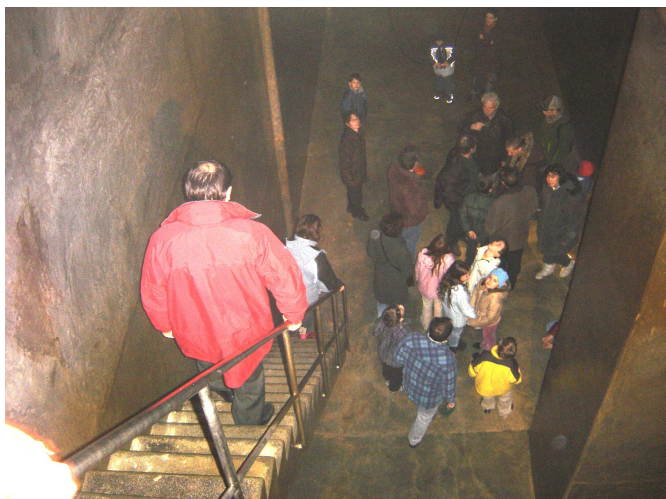
La visite du réservoir de la Chablère permet aux habitants de prendre conscience de l'importance de l'eau et du patrimoine public. janvier 2006