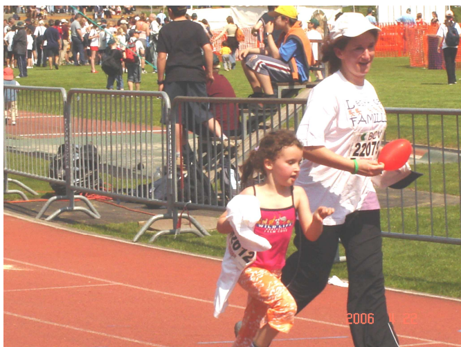
Courir pour le plaisir en famille, après une série d'entraînements dans le quartier. Avril 2006