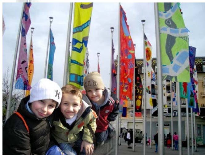
Le pavillon de l'animation hissé haut à Ouchy